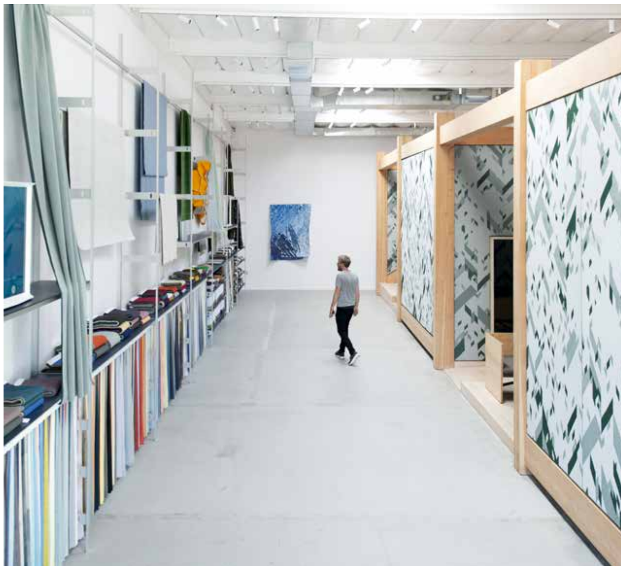
■ Above: axonometric projection of the main structure with various rooms and an open-view mezzanine on the upper floor. Below left and bottom: detail of the wooden structure that frames the Kvadrat Cilos knit fabric; the shelving along the wall on the left hosts the textile archive-catalogue