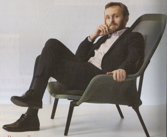
산업 디자이너 에르완 부홀렉Erwan Bouroullec 내면의 감정을 건드리는 디자인

서울리빙디자인페어 삼성전자 부스에서 만난 세리프 TV의 디자이너 에르완 부홀렉