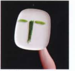
Ovale collection, 2010

Beneath a textile vault rising twelve meters high, the Bouroullecs present their light screens and filters created through the assembly of basic elements — Algues, North Tiles, Twigs, and Clouds —, which generate an abstract and surprising landscape.