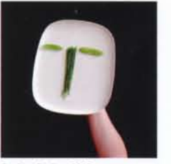
Ovale collection, 2010

Beneath a textile vault rising twelve meters high, the Bouroullecs present their light screens and filters created through the assembly of basic elements — Algues, North Tiles, Twigs, and Clouds —, which generate an abstract and surprising landscape.