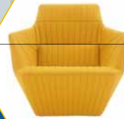
FAUTEUIL FACETT CHEZ LIGNE ROSET

2 volets d'exposition : Le premier est consacré au mobilier créé par le duo au fil de leur carrière. Chaises, tables, bureaux, assiettes... Le processus de création est expliqué et illustré par des maquettes, croquis et archives privées. Le second volet donne à voir, pour la première fois en France de nouveaux systèmes de cloisons modulaires, thème favori des 2 designers, en céramique, verre textile ou guipure.