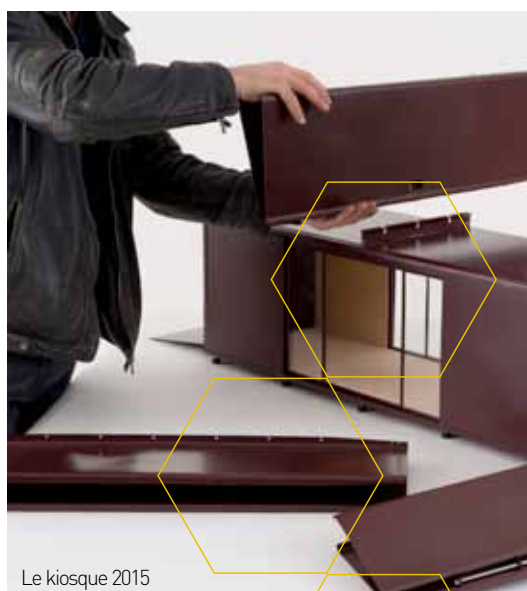
Le kiosque 2015