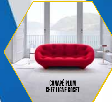
CANAPÉ PLUM CHEZ LIGNE ROSET