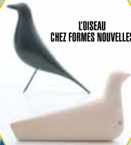
L'OISEAU CHEZ FORMES NOUVELLES