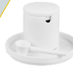
SUCRIÈRE EN PORCELAINE CHEZ HABITAT