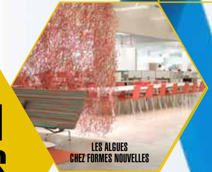
LES ALGUES CHEZ FORMES NOUVELLES