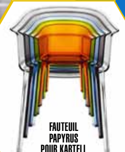
FAUTEUIL PAPYRUS POUR KARTELL CHEZ FORMA DESIGN