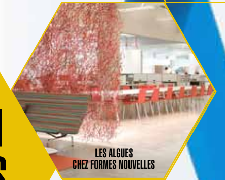
LES ALGUES CHEZ FORMES NOUVELLES